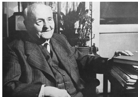
Obr. 1 Nad dílem akademika Zd. Wirtha, Zprávy památkové péče 18, s. 3.