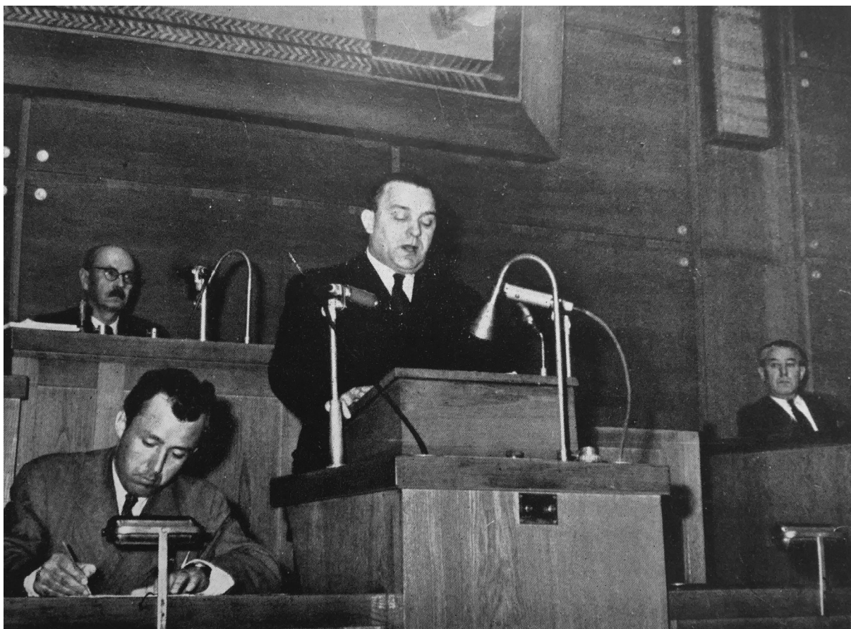
Obr. 4 Projev ministra školství a kultury dr. Františka Kahudy k projednání zákona o kulturních památkách v Národním shromáždění dne 17. dubna 1958. Zprávy památkové péče 18, s. 3.

S konečnou platností tedy zákon přenesl navrhovanou pravomoc ústředního památkového odborného orgánu určit v pochybnosti, zda je věc památkou (rozuměj památkou chráněnou státem) na krajský národní výbor (§ 2 odst. 3), přičemž odbornost rozhodnutí měla být zajištěna předchozím posudkem památkového ústavu.