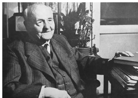
Obr. 1 Nad dílem akademika Zd. Wirtha, Zprávy památkové péče 18, s. 3.