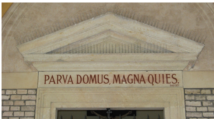
Obr. 3 Vyšehradský hřbitov, Praha, detail hrobky s latinským textem.

Předkládaný článek rámcově prezentuje smysl a průběh výuky latiny na Fakultě restaurování Univerzity Pardubice. První část je reflexí nad využitím znalostí tohoto jazyka v restaurátorské praxi, druhá část je zaměřena především na výuku jako takovou, deskripci sylabu a metodologie výuky.