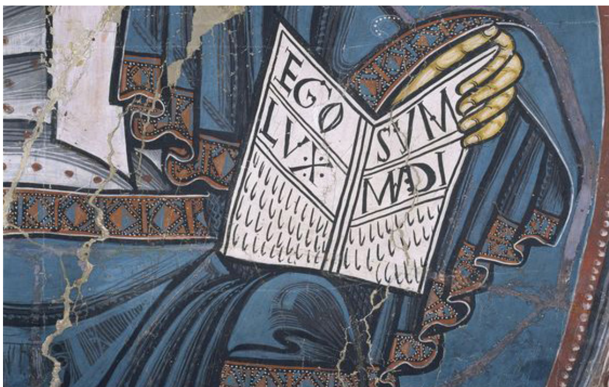
Obr. 1 Freska ze Sant Climent de Taüll, detail s latinským textem.

The aim of this article is to outline the purpose and process of implementing Latin teaching for Bachelor's degree courses at the Faculty of Restoration, University of Pardubice. In the first section, the reasons for studying Latin and the future application of acquired knowledge in the practical sphere are defined. The second section is devoted to the analyses of syllabus content and teaching methodology. Additional illustrative samples of selected Latin grammar and lexicon complement the text.