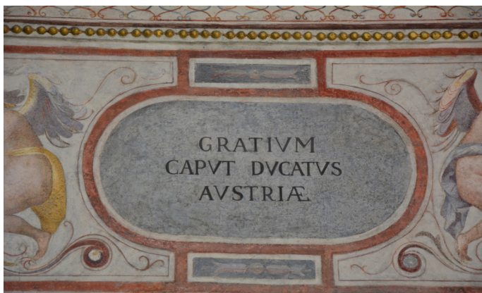
Obr. 2 Palazzo Vecchio, Florencie, detail nástěnné malby s latinským textem.